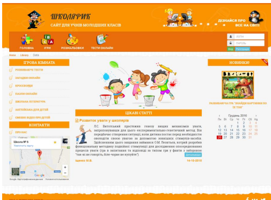
Рисунок 2 – Вигляд розробленого інтерфейсу