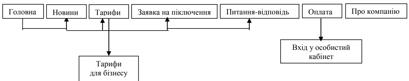
Рисунок 4 – Модель роботи мобільного сайту «ВІК Телеком»