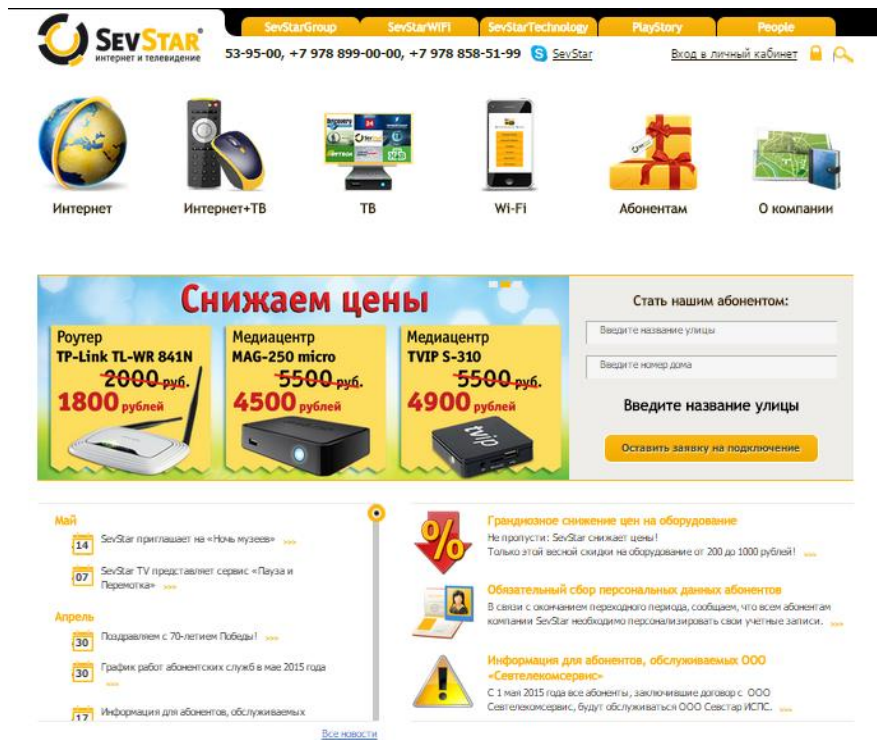
Рисунок 2 – Головна сторінка сайту Інтернет-провайдера SevStar